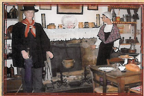
Un intérieur berrichon