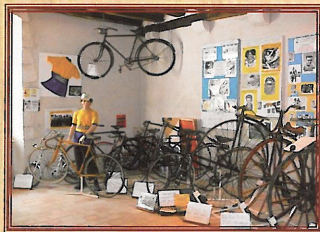
Les cycles DILECTA

On peut également y voir une pharmacie d'antan, un espace dédié à la grande cantatrice Mado Robin -qui fut la plus haute voix du monde-, originaire de notre région, et une exceptionnelle collection de cycles du XIX ème siècle jusqu'aux années cinquante ; elle rappelle le passé industriel de la ville (cycles Dilecta).