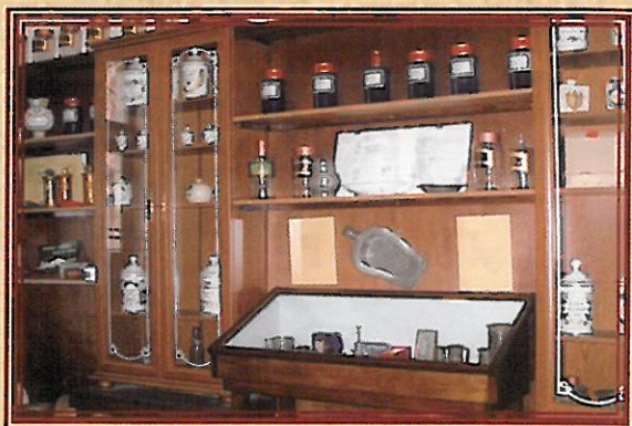
Une ancienne pharmacie