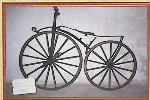
Une exceptionnelle collection de cycles anciens

D écouvrez la maison médiévale des Amis du Blanc, nichée au cœur de la Ville Haute, et laissez vous séduire par son parfum d'antan.