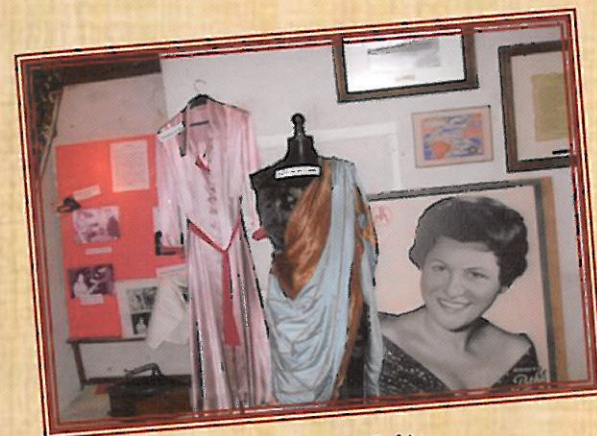
Hommage à Mado Robin